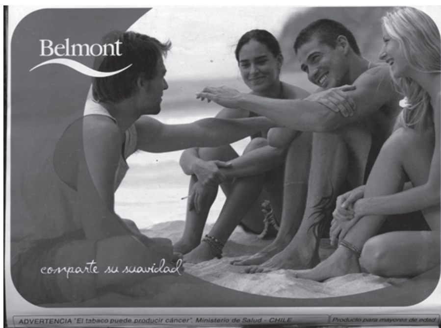
Figura I. Publicada en contra-tapa Revista "TV Grama", I -7 Marzo 2002